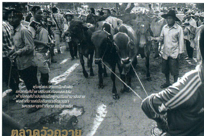
ตลาดวัวควาย นายอ้อยยุครดบรรทุก

พื้นที่กระจายหมื่นพันคน แต่กิจกรรมที่สาธยายชวนเคลือบ พียงอยู่ไม่กี่คนยืนมือพุดนเรณีย์ นานจนซา พอถึที่นั่นมาแต่เมื่อถึงพระประธา รอนสกลากำปั่นมาจากทั่วสารทิศ