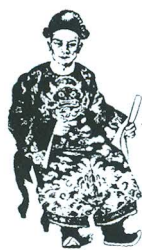
左軍大將軍黎文悅