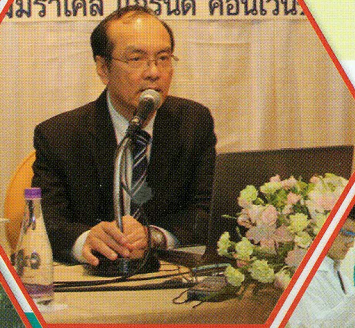
สมิราเคิล แกรนด์ คอนเวนชั่น