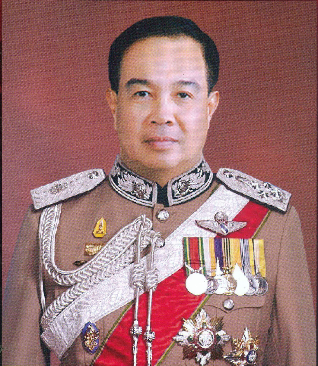
พลตำรวจเอก สมยศ พุ่มพันธุ์ม่วง ผู้บัญชาการตำรวจแห่งชาติ