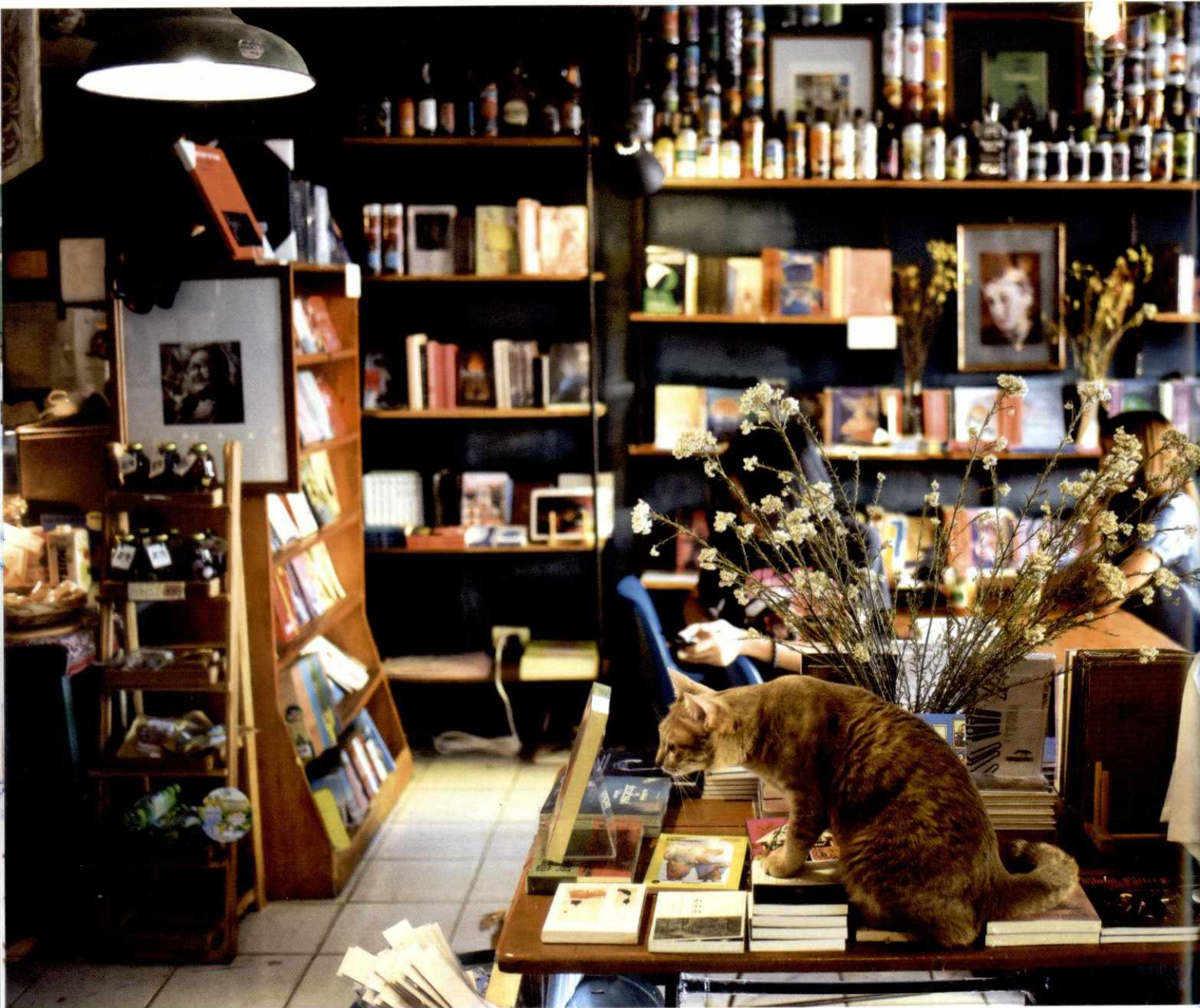
ร้าน A BOOK with NO NAME เขตตลิ่งชัน กรุงเทพมหานคร