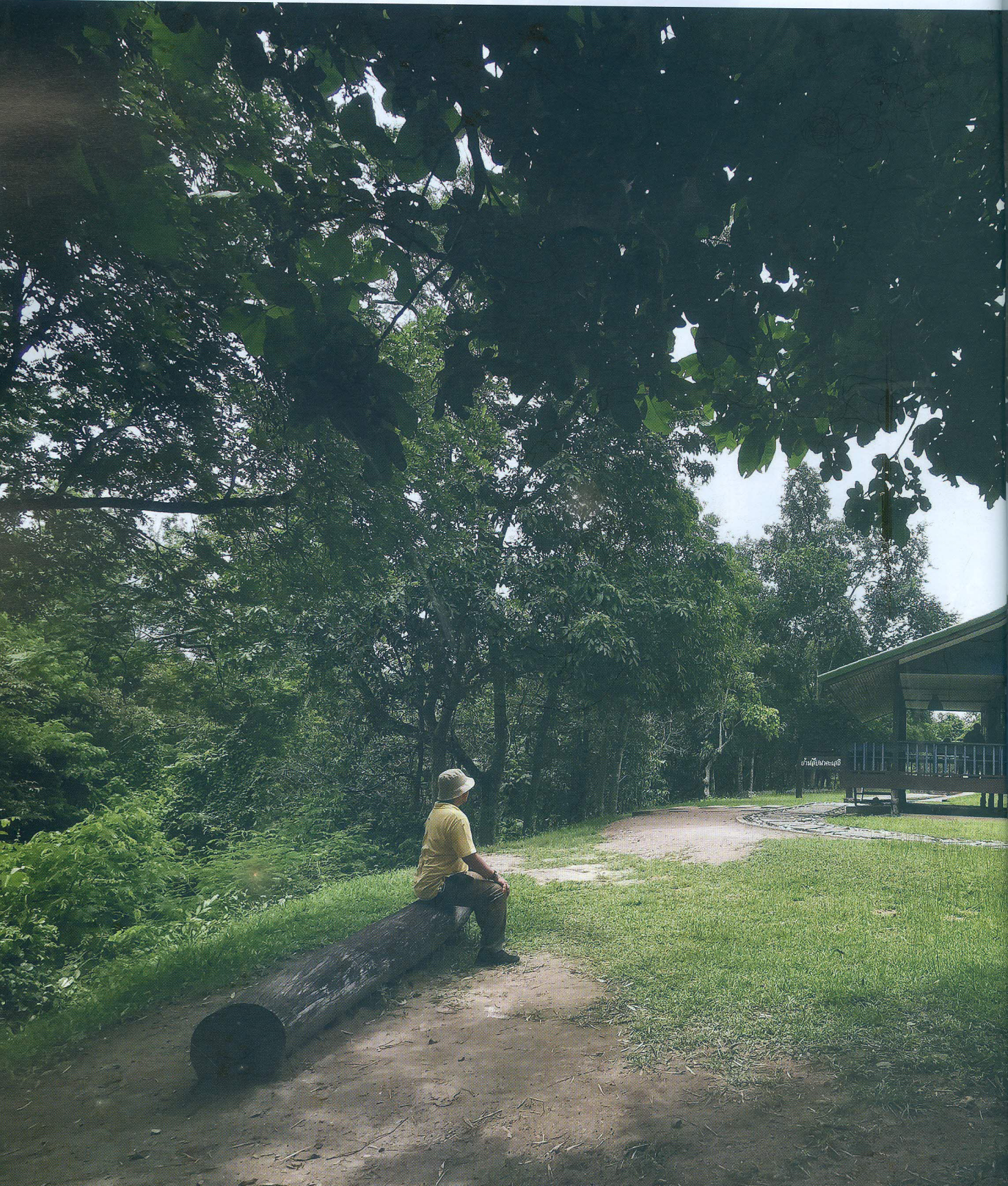
ภาพถ่ายในปี ๒๕๖๓ บ้านพักของหัวหน้าฯ สิบ นาคะเสถียร บริเวณที่ทำการเขตรักษาพันธุ์สัตว์ป่าห้วยขาแข้ง ปัจจุบันเก็บรักษาไว้ในสภาพเดิม