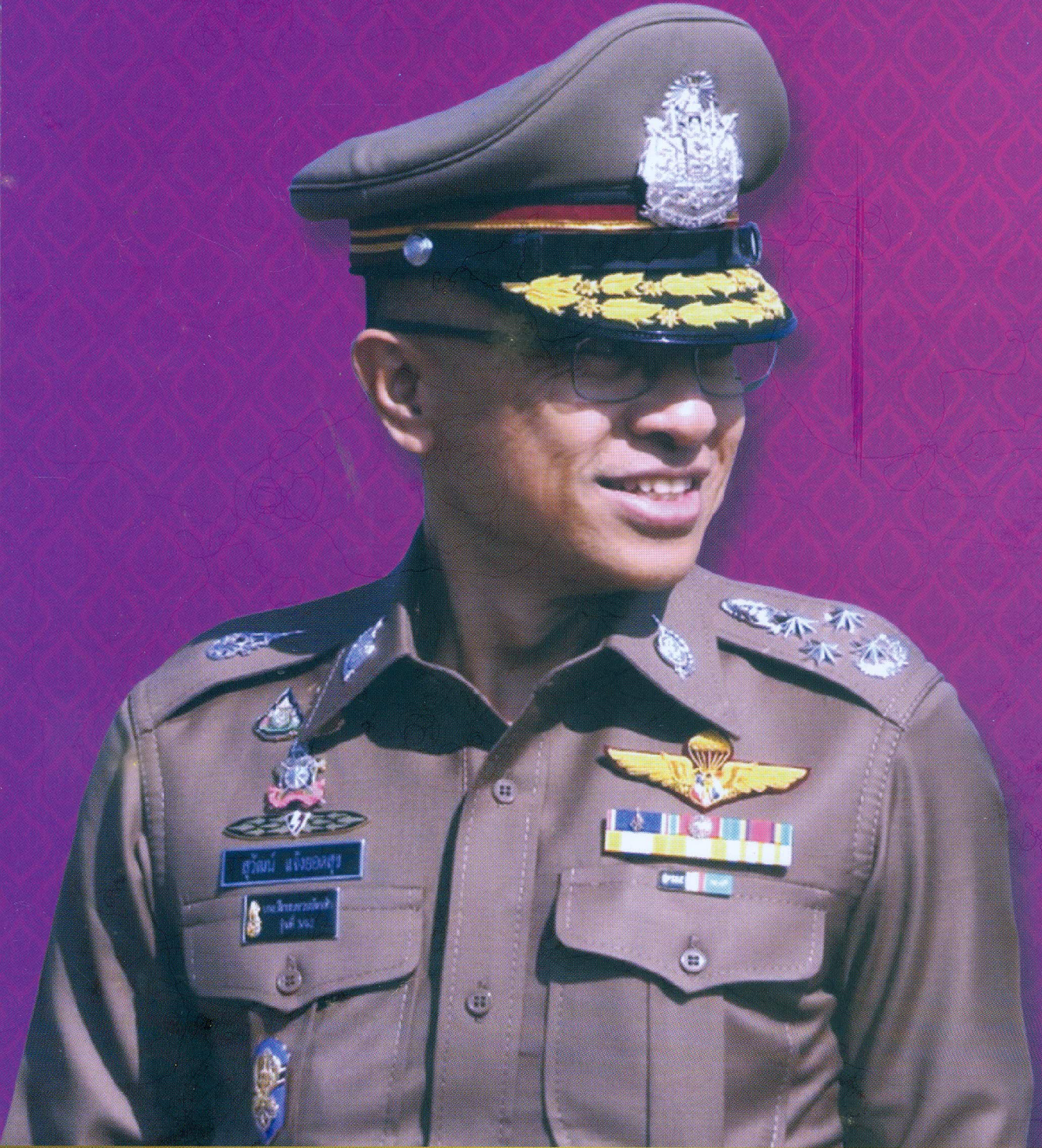
พลตำรวจเอก สุวิวัฒน์ แจ่มยอดสุข ผู้บัญชาการตำรวจแห่งชาติ