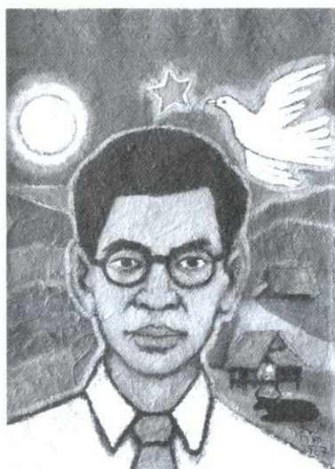
"นายผีศึกษา" ตอนจบ (น.๔๐)

๑๑๘ เวียงจันทน์นั้นใจ | "คมศิลป์", ถอดคำ "จินตริย์" ๑ ทศวรรษค่ายพักนักเขียนหนุ่ม "เตรียมฉลอง ๑๐ ปี บนสายทางวรรณกรรมลาว"