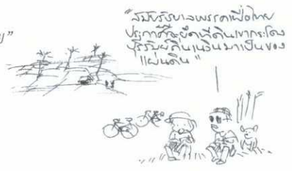
"ช่วงบักจุก" (น.๑๑)

๑๑๖ เรื่องเล่าชุดพ่อเฒ่ากับลูกเขย | "ซัด การชนะ", ภาพ ศิลป์วัตร วิชาลศักดิ์ เขาคัก