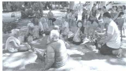
ลมหายใจที่ถูกลืม บนเส้นขนานไทย-กัมพูชา (น.๗๘)