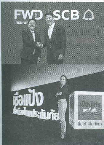
ประกันชีวิต ประกันภัย