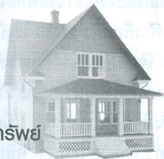
อสังหาริมทรัพย์