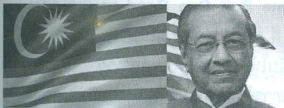
โลกเงินตรา